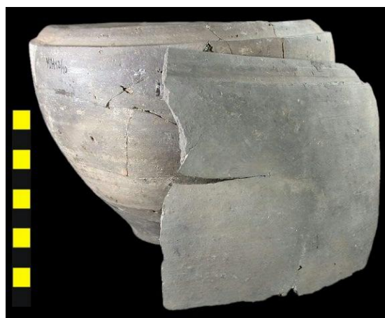
Afb. 1: Pot, type Halder 4a, en scherf met scheur

Helaas voor de pottenbakker van Halder gebeurde het nogal eens dat er tijdens het bakproces een of meer potten sneuvelden. Ze kwamen gebarsten uit de oven of waren tijdens het bakken uit elkaar gevallen. Dit waren misbaksels en werden ter plaatse weggegooid.