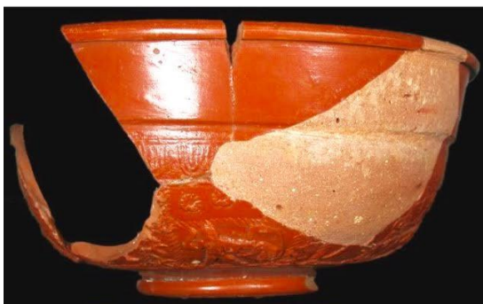
Afb. 1 Kom van terra sigillata uit Halder, type Drag. 37 http://www.romeinshalder.nl/collectie/zoeken-in-alle-vondsten/alle-typen/Drag37

Deze vraag vormt een mooie aanleiding om nader onderzoek te doen naar de merkwaardige afbeelding op een kom van terra sigillata uit Halder (afb. 1). Het gaat om het fragment van een kom (vondstnummer MiH 9.33) type Dragendorff 37.