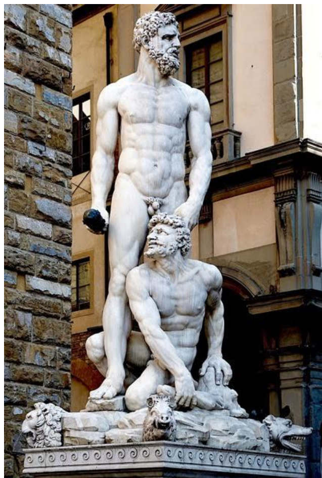
Afb.3 Baccio Bandinelli: standbeeld van Hercules-Cacus op de Piazza della Signoria in Florence

Terra sigillata-kommen met deze voorstelling komen niet veel voor. In Nederland zijn mij twee parallellen bekend, een uit Voorburg (Arentsburg) en een uit Vechten (3). Het Hercules-Cacus verhaal was zeker populair in de Oudheid, ook al hoorde het slechts indirect tot de Twaalf Werken. Vergilius en Ovidius hebben erover geschreven en in het Oude Rome konden kinderen met eigen ogen "de grot van Cacus" op de Aventijn en "de trap van Cacus" op de Palatijn bewonderen.