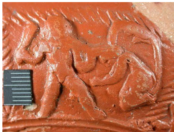
Afb. 2 Mythologische voorstelling op de kom uit Halder, detail van Afb. 1

Van de kom is juist voldoende bewaard gebleven om het hele profiel te kunnen vaststellen. Ze is gefabriceerd in Lavoye, een piepklein plaatsje in het noordoosten van Frankrijk. Het stuk dateren is moeilijk, er is niet meer over te zeggen dan dat het geproduceerd is na 150 na Chr. De kwaliteit is matig, hetgeen tot uiting komt in de onscherpe contouren van de gestempelde versiering. Waarschijnlijk is het stempel in de werkplaats al vele malen gebruikt. De versiering bevindt zich op de onder-