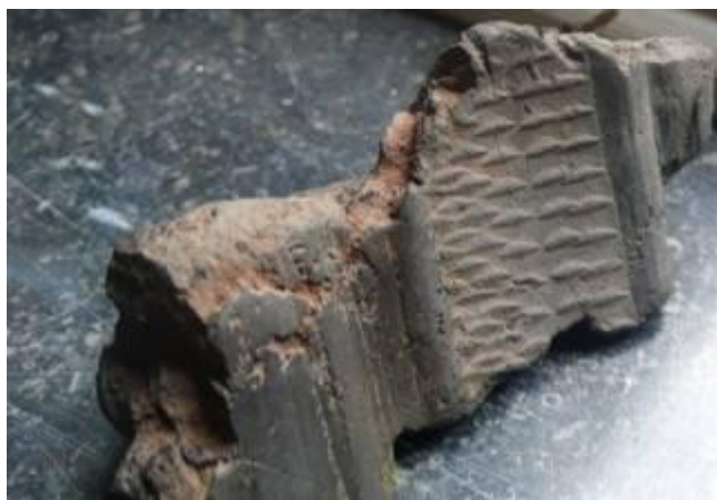
Afb. 2: Kleiprop met afdruk van versiering

Dan zijn er nog de kleipropen (afb. 2) : kluitjes klei waarmee een stapel potten werd vastgezet om omvallen te voorkomen.