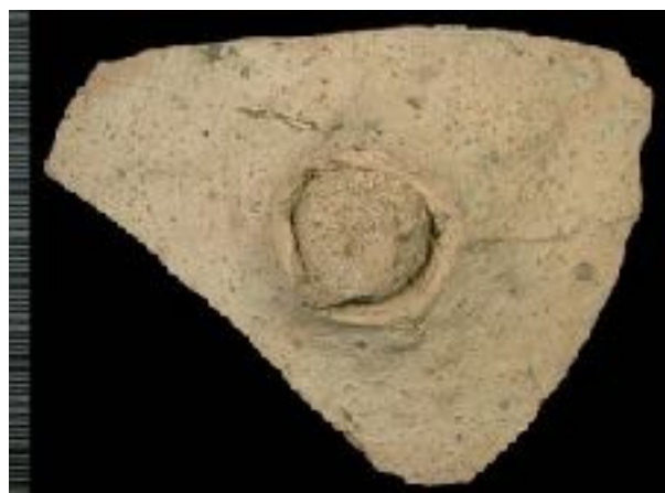
Afb. 3 Bodem van Dressel 20 met aanzet van punt.

Een detail tot slot: de Dressel 20 heeft een typische ronde bodem met een punt in het midden. Deze puntige bodem diende om de amfoor stevig neer te zetten in een zachte ondergrond, bijvoorbeeld zand of stro. Op Halder zijn twee bodem-fragmenten met zo'n punt gevonden, zie afb. 2 en 3.