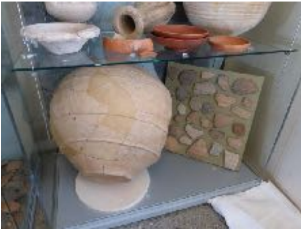
afb. 4 Het dolium is succesvol geplaatst in de huidige vitrine met het importaadewerk voor de keuken.