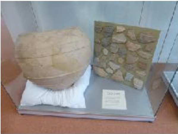
Afb. 1 Het dolium zoals het er uitzag voordat het uit elkaar viel. Naast het dolium staat een bord met daarop 30 fragmenten van andere dolia, alle met een andere versiering, zodat er in Halder minstens 31 dolia in gebruik zijn geweest.