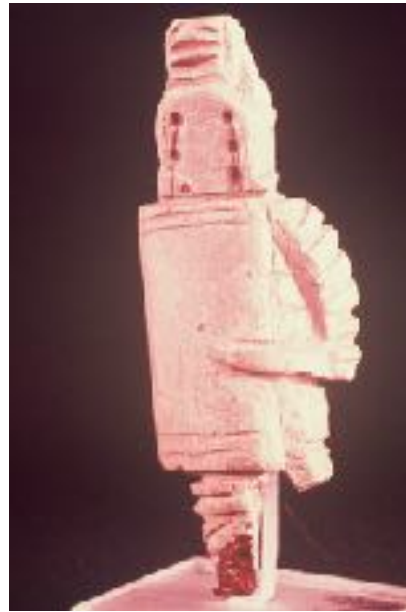
afb. 5 Ivoren gladiatorenbeeldje uit Nîmes; hoogte 9 cm

Het gaatje bovenaan is niet het oog van een vogeltje, maar dient om er een koordje door te halen waaraan de helmpjes kunnen worden gedragen. Ze komen zo vanzelf in de juiste positie te hangen.