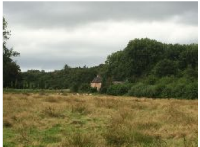
afb. 3 Het Vaantje

Door een huwelijk kwam het in bezit van de familie Senarciens de Grancy. Deze familie was nog eigenaar toen het landgoed in de jaren tachtig overging naar Het Brabants Landschap.