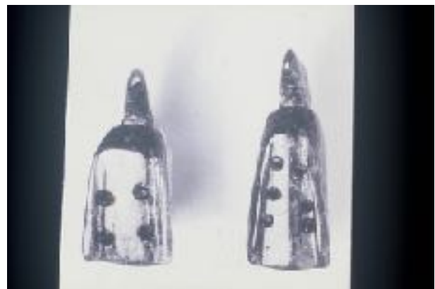
afb. 3a Barnstenen hangertjes uit Esch (graf V, Hoogkeiteren); zijaanzicht; hoogte 18 en 20 mm

In Halder is de oogst met die ene scherf dus niet groot. Maar uit Esch valt op het gebied van gladiatoren nog een curieus verhaal te vertellen. In graf V van Hoogkeiteren (“het graf van de rijke dame”) is een viertal voorwerpen van barnsteen gevonden, waaronder het Bacchusbeeldje.