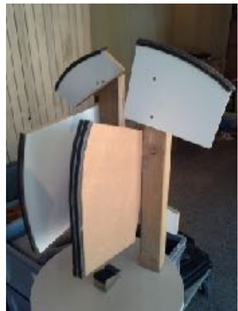
afb. 3. De ondersteunende constructie.

bouwde voor ons onder andere de vitrines voor de soldaat en voor de originele onderdelen van het Romeinse slot) bedacht een steunconstructie, waardoor het dolium zo goed als spanningsloos geëxposeerd kan worden. Zijn constructie is nu niet meer te zien, want daar rust het dolium overheen, maar hij is zo bijzonder dat het goed is om hem in dit artikel wel te tonen, want het lijkt wel een moderne sculptuur.