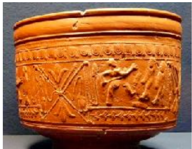
afb. 2 Terra sigillata beker type Dragendorff 30 uit Asciburgium

In de collectie van het museum bevindt zich één scherf met een voorstelling uit de gladiatorenwereld (afb. 1).