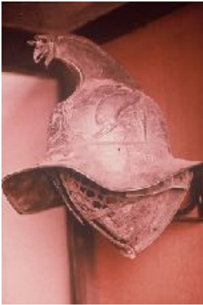
afb. 4 Originele gladiatorenhelm uit Pompeï

door het leven onder de benaming “vogeltje”, “amulet”, “vogelachtig figuurtje”, “dolfijn”, altijd met een vraagteken erachter. Pas in 1980, 20 jaar (!) na de opgraving van graf V, kwam drs. J.R.C. van Zijll de Jong uit Nijmegen met de verrassende oplossing: het zijn gladiatorenhelmen!