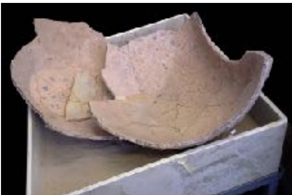
afb. 2. Het dolium zoals dat in stukken naar het Groot Tuighuis is gebracht.

Goed is te zien hoe indertijd de stukken aan elkaar zijn geplakt, te beginnen met de bodem (de stukken gemerkt met de letter B). In het Groot Tuighuis heeft Angelo, samen met enkele andere restauratoren (want zo iets groots kun je niet alleen lijmen), de stukken weer aan elkaar geplakt, weer met celluloselijm, omdat dat geen onherstelbare veranderingen veroorzaakt.