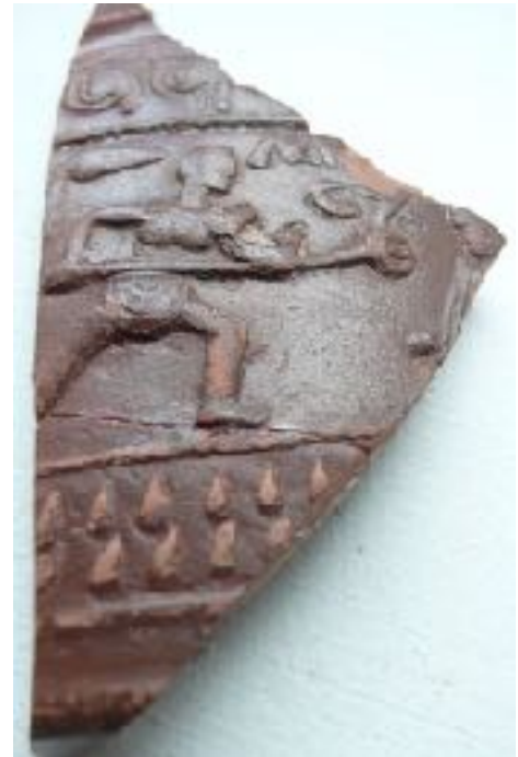
afb. 1 Scherf van terra sigillata uit Halder, lengte 10 cm