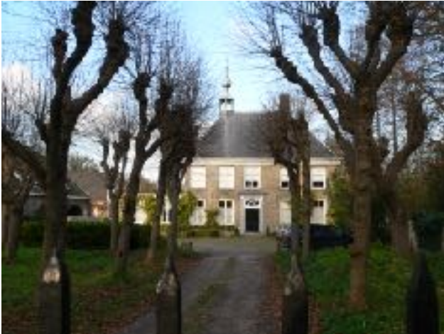
afb. 1 Huis Haanwijk