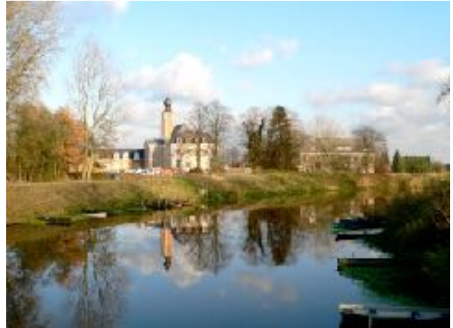
afb. 2 Nieuw Herlaer

Vanaf ongeveer 1300 ontwikkelden de steden zich in een snel tempo tot compacte ommuurde leefgemeenschappen. Een stad