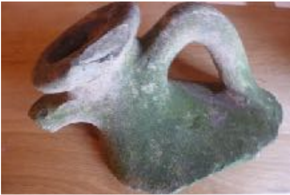
afb. 1 Fragment van amfoor Dressel 20 uit Nijmegen/Vught. Diameter hals: 12 cm.

Ongeveer 50 jaar geleden kreeg hij van een tante in Nijmegen een groot fragment van een amfoor waarvan hij vermoedde dat het wel eens Romeins kon zijn. Hij heeft het al die tijd bewaard, jarenlang als decoratie in zijn tuin.