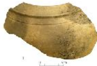
Fragment van een klein, handgevormd dolium, een nieuw type aardewerk uit de oven van Halder.