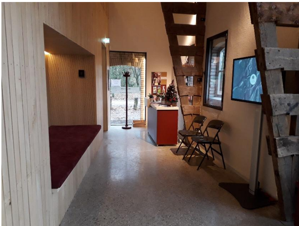
De nieuwe ontvangstbalie in onze huisstijlkleuren, met in december een klein kerstboompje