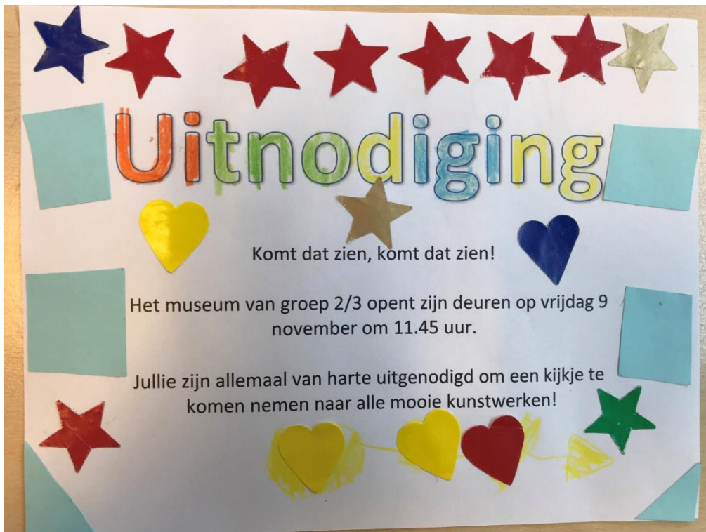
De uitnodiging was door de kinderen zelf gekleurd en versierd.

In het najaar heeft Nienke Bressers, PABO-student, tijdens haar stage bij ons het project "Museum in de klas" ontwikkeld, uitgevoerd en geëvalueerd. Zij heeft onderzocht hoe het mogelijk is om kinderen van groep 2 en 3 van de basisschool te leren wat een museum is en wat een archeoloog doet.