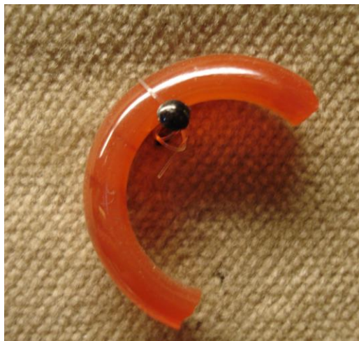
Fragment van een vingerring (Mi-ES-02).

In de collectie van het museum bevinden zich drie vondsten van halfedelsteen, alle van carneool: een Romeins fragment van (waarschijnlijk) een vingerring (Mi-ES-2), een Romeins ringsteentje (MiH-ES-1) en een betrekkelijk recent fragment van een kraal (Mi-ES-1). Dateringen zijn moeilijk te geven omdat er weinig vondstomstandigheden bekend zijn.