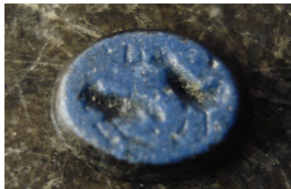
Afb.4: glazen ringsteentje, imitatie nicolo (GM-G-01).

Voor de volledigheid en als vergelijking wordt hier nog een ringsteentje uit de collectie gepresenteerd. Het is een glazen imitatie van een (half-) edelsteen van gelaagde onyx, een zgn. nicoló uitgevoerd in zwart en kobaltblauw opaak glas. De tamelijk zeldzame ringsteen is gevonden in Gemonde - de Hogert en gepubliceerd (Verwers W., 1992: 141-180). Het steentje is compleet en eigenlijk ontbreekt alleen de ring (van ijzer, zilver of brons; in een kostbare gouden ring zal eerder een echte