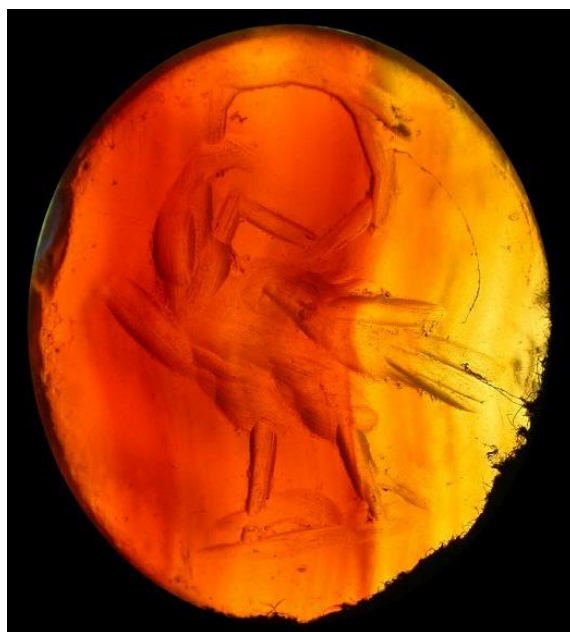
Het ringsteentje (MiH-ES-01).

exemplaar is gevonden te Syrië en dateert uit de eerste eeuw na. Chr. Op dit laatste exemplaar is een slijpvlak aangebracht met een inscriptie (Lunsingh-Scheurleer 1997: 30). Het exemplaar in ons museum is niet compleet. Het blijft daarom onbekend of er ook een 'ringsteen' - al dan niet met inscriptie - op aangebracht is geweest. Een andere ring van carneool, maar meer bewerkt, is gevonden te Heerlen (Thermenmuseum Heerlen inv.no. 11421; Sas en Thoen 2002: 204).