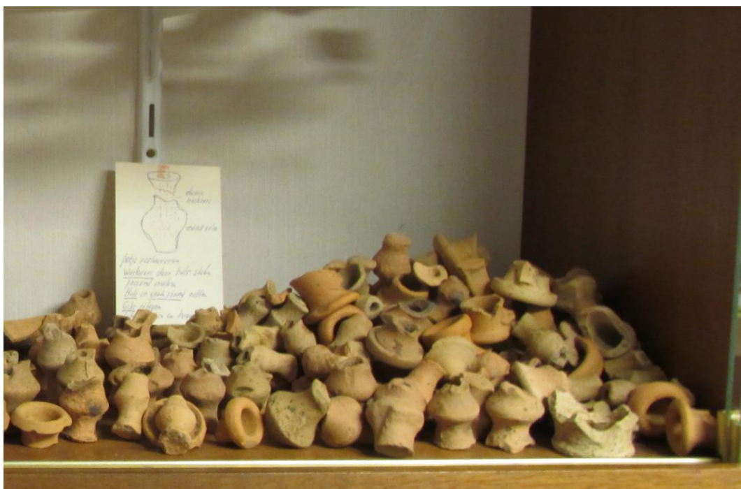
Miniatuur-offerkruijkes uit Pommern, uitgesteld in ons oude museum.