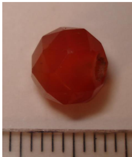
Gefacetteerde kraal van carneool (Mi-ES-01).

De intaglio afbeelding is een adelaar naar links gericht die een zegekrans in zijn bek naar rechts houdt. De adelaar komt vaker voor in ring- en zegelstenen en staat voor Rome en haar macht. De afbeelding wordt nogal eens in militaire context aangetroffen. (Is er een veteraan teruggekeerd naar zijn geboortegrond nabij Sint-Michielsgestel?) Vergelijkbare exemplaren, een adelaar naar links gericht en een adelaar met een zegekrans in de bek tussen twee signa (veldtekenen), bevinden zich in de Borowski collectie (Bianchi R.S.(ed.), 2002). 1 Andere vergelijkingsexemplaren bevinden zich in de collectie van Museum Het Valkhof te Nijmegen, zoals een ronde carneool met een adelaar staande op een bliksemschicht, een glazen imitatie-nicoló met een adelaar naar links gericht eveneens met een zegekrans naar rechts en nog een glazen nicoló met een adelaar met uitgespreide vleugels (Maaskant-Kleibrink M., 1986). 2 In het Rheinisches Landesmuseum te Trier bevindt zich nog een ring met een gouden zegel met een bijna identieke adelaar (Krug A., 1995, catalogusnummer 17, p. 55 + tafel 46-17.). De derde vondst (vondstnummer Mi-ES-01) is een met facetten (vlakken) geslepen kraal van oranjebruine carneool van circa 6,5 mm grootte. Deze kraal kan afkomstig zijn van een kralenketting of van een rozenkrans; in beide gevallen van een rijke boerin of stadse dame. Het voorwerp zal niet zo lang geleden verloren zijn als de twee eerder beschreven vondsten, waarschijnlijk in de 19 de of 20 ste eeuw.